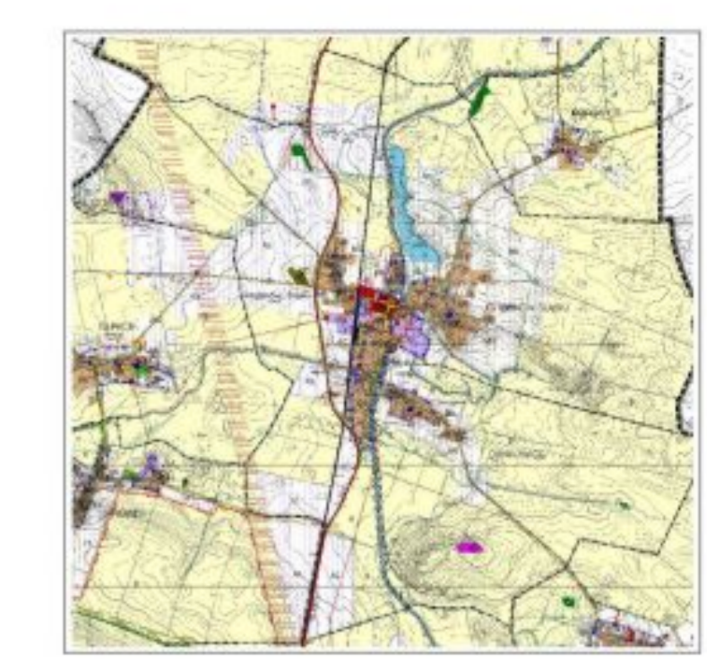
WYRS Z STUDIUM UWARUNKOWAŃ I KIERUNKÓW ZAGOSPODAROWANIA PRZESTRZENNEGO GMINY JORDANÓW ŚLĄSKI

Załącznik nr 1 do uchwały Nr XXVI/144/2009 Rady Gminy Jordanów Śląski z dnia 31 lipca 2009 roku